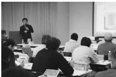
ハンドレンズによる木材の見分け方を講義する杉山教授（大阪会場）