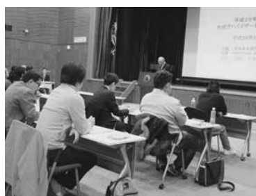
市川会長が開講式で挨拶

東京会場では、当連盟の市川会長が挨拶、講習会について、「この講習会は、木材や木材利用の助言・指導ができる人材を養成し、木材アドバイザーとして認定し、その方々の活動により、広く森林や木材、木造建築の良さを建築関係者や一般国民の皆さんに伝えて頂くこと、全日本木材市場連盟がスタートさせた」と話し、また「企画運営は、森林・林業、木材、建築などの分野で、それぞれ第一