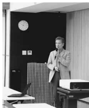
「環境問題は正しい理解が大切」と森川教授（大阪会場）