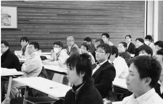
真剣な表情で、講義を聴く受講者（大阪会場）