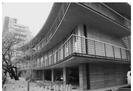
【大阪木材仲買会館】