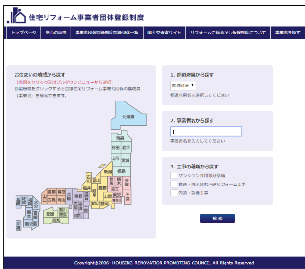
〈検索サイトトップページ〉

◆サイトの URL : http://www.j-reform.com/reform-dantai/kensaku.php