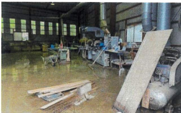
《被災した木材加工流通施設》