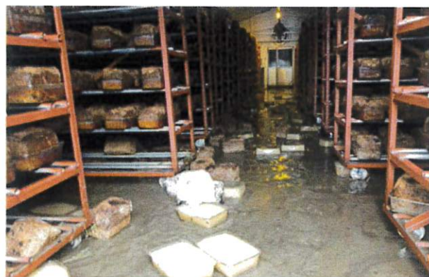
《被災した特用林産振興施設》