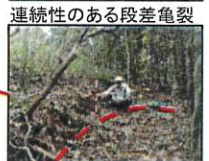
崩壊地上部の段差亀裂